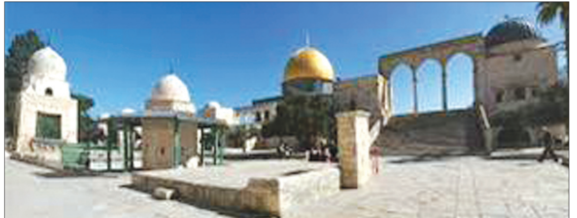
황금 사원의 전경