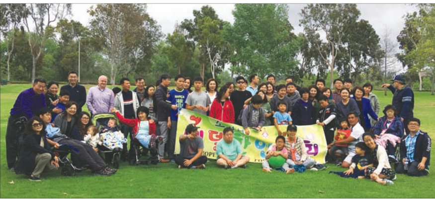
베델한인교회 소망부 봄소풍

한편, 대화교육원 측은 “6월부터는 2세 자녀를 위하여 영어 교재로 대화교육이 진행되며 영어권 강사가 배출될 계획”이라고 전했다.