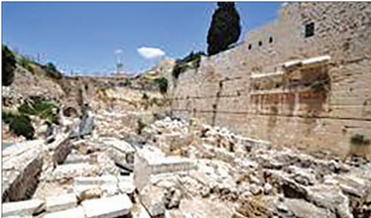
성전 산의 흔적 일부