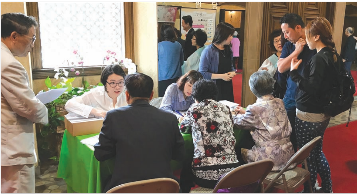
나성순복음교회는 지난 20일 주일예배 후 성도들의 유권자 등록을 돕는 부스를 교회 곳곳에 마련했다.