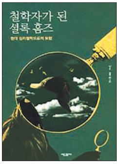
철학자가 된 설록 홈즈 리브 김 새물결플러스 | 256쪽

뿐 느껴집니다. 코난 도일의 소설이 교수님의 인생과 가치관에 미친 영향이 어느 정도인지요.