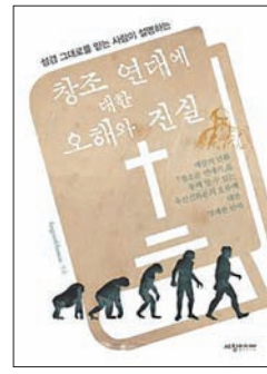
창조 연대에 대한 오해와 진실 핑거 오브 토마스 세창미디어 | 264쪽

해 공개토론할 준비가 되어 있으며 그런 합리적인 토론을 통해 많은 기독교인들이 각 이론의 장단점과 논리를 잘 이해할 수 있기를 바란다"고 밝혔다.