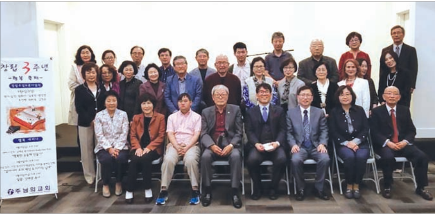
벤추라 따우전옥스에 위치한 주님의교회에서 행복 세미나가 열렸다.