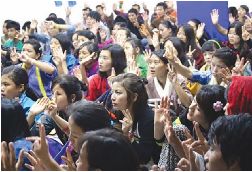
부탄 교회의 여름 청년 캠프가 진행되고 있다.