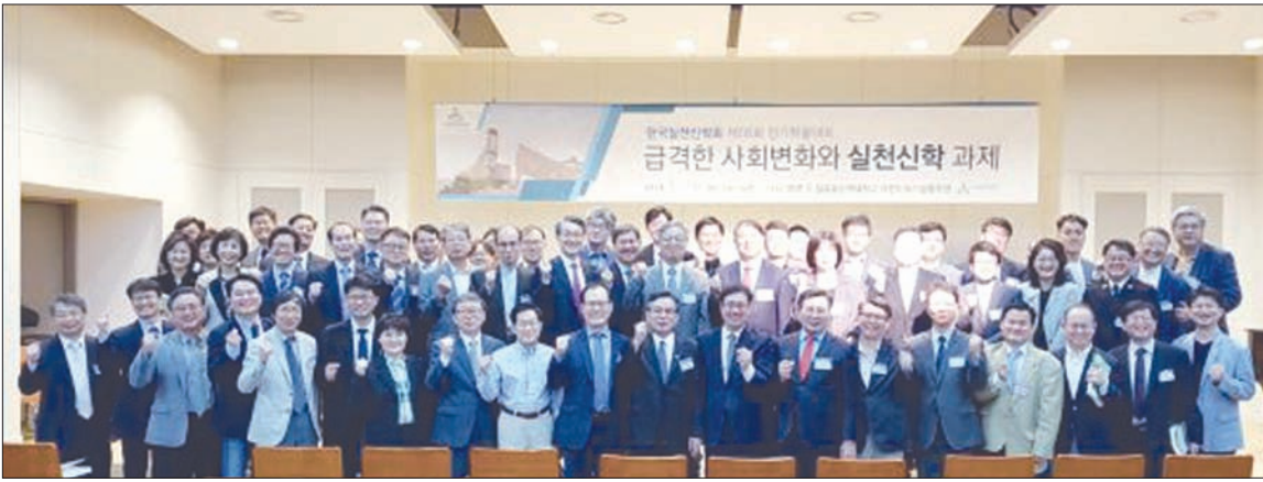
개회예배 후 기념촬영이 진행되고 있다.