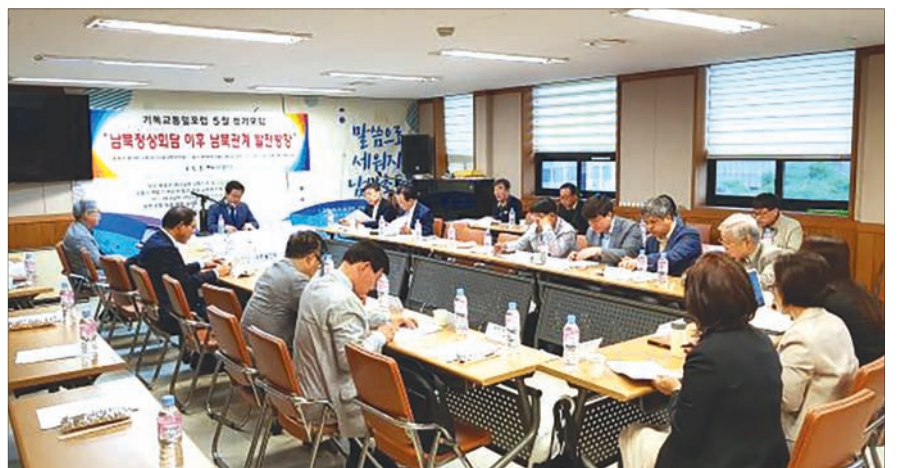
발표가 진행되고 있다.