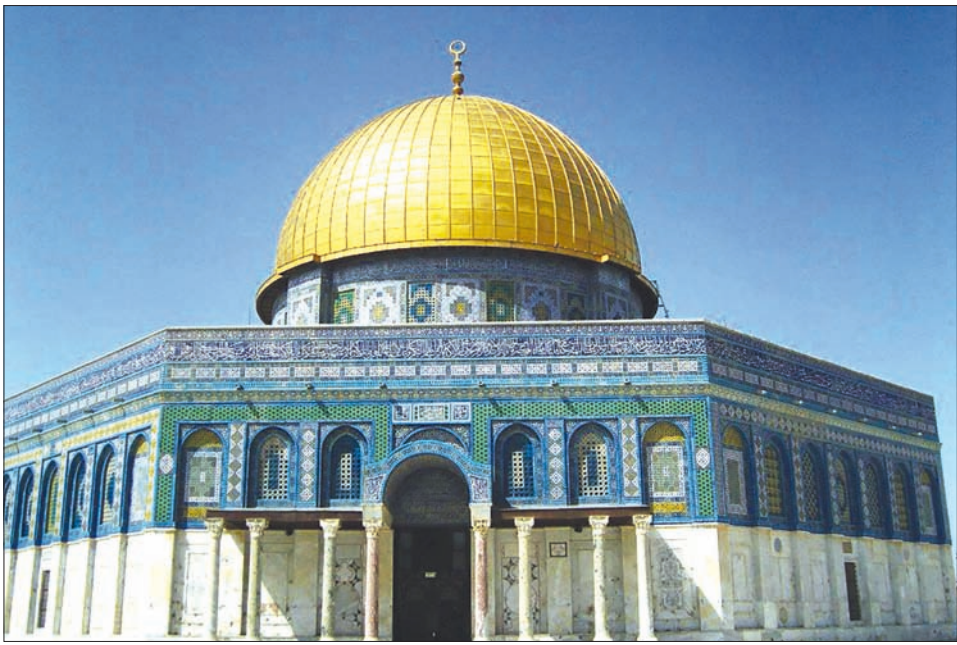
황금 사원의 모습