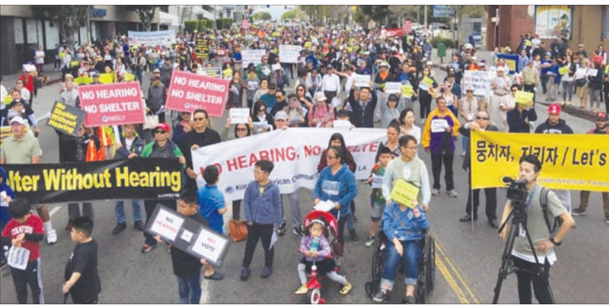
한인타운 노숙자 쉼터를 반대하는 집회 모습