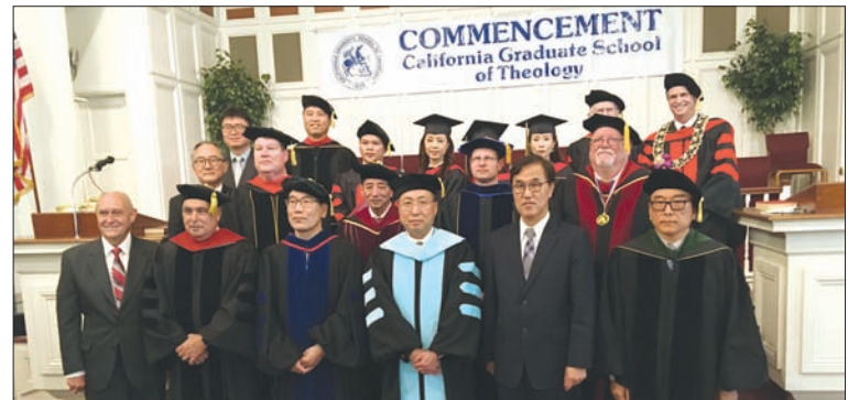
졸업생들과 교수들이 졸업식을 마치고 기념촬영했다.

이 학교는 TRACS의 인가를 받아 정식 학위를 수여하고 있다. 주소) 11277 Garden Grove Bl. Garden Grove, CA 92843 전화) 714-638-8310(한국어) 웹사이트) www.cgsot.edu