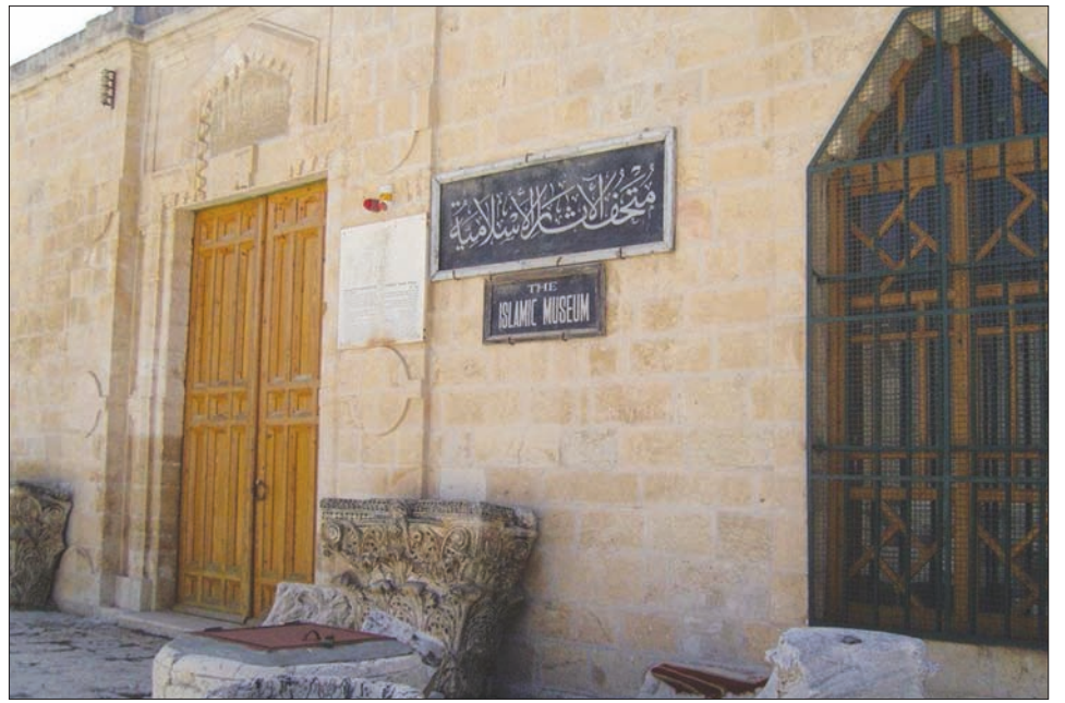
성전 산에서 볼 수 있는 이슬람 박물관