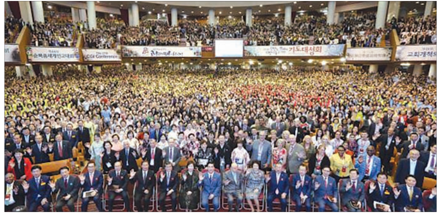
60주년 기념예배 후 기념촬영을 하고 있다.