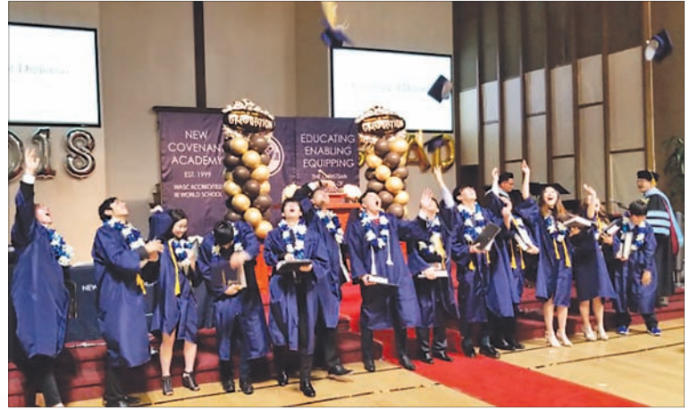
NCA 졸업식이 거행됐다.

한편, NCA는 한인이 한인타운에 설립한 최초의 기독교 사립학교로 WASC 정식 인준학교이며 IB(국제 공통대학입학자격) 디플로마 프로그램을 제공하고 있다. NCA는 상대적으로 저렴한 학비와 안전하고 가족적인 분위기의 학교로 알려져 있다.