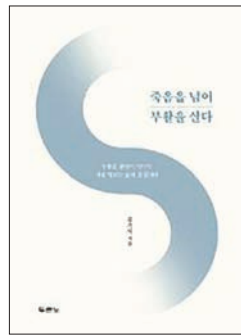
죽음을 넘어 부활을 살다 김기석 두란노 | 256쪽

저자는 ‘해가 막 돋은 때’(막 16:1-8)에서 “예수 그리스도의 부활이 우리에게 말해주