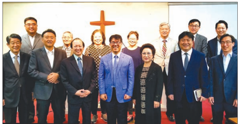
사우스베이목사회 월례기도회를 마친 후 기념촬영했다.

문의) 한인기독교상담소 (kaccla.net) 전화) 213-738-6930 (LA) 657-529-1133 (OC)