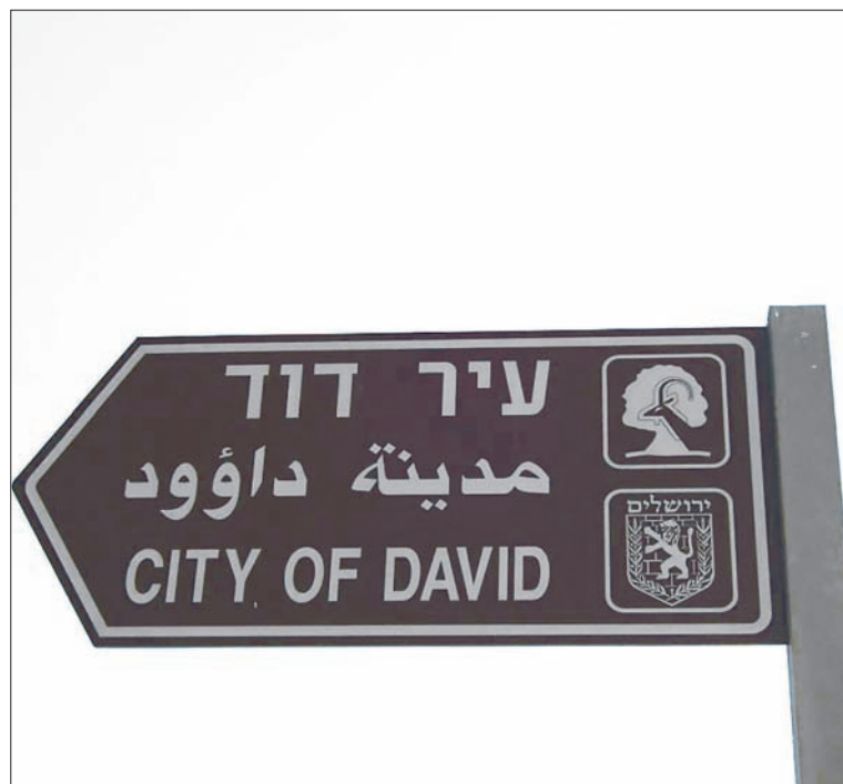
다윗의 도시로 가는 안내판