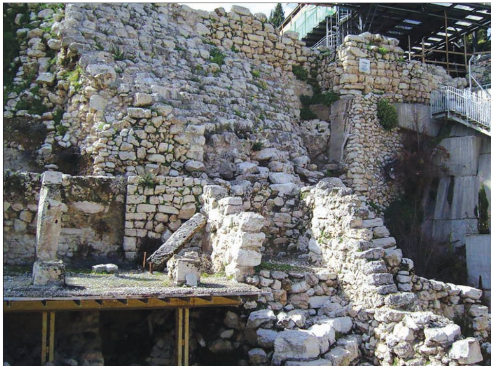
현재까지 되어 있는 고고학적 발굴들