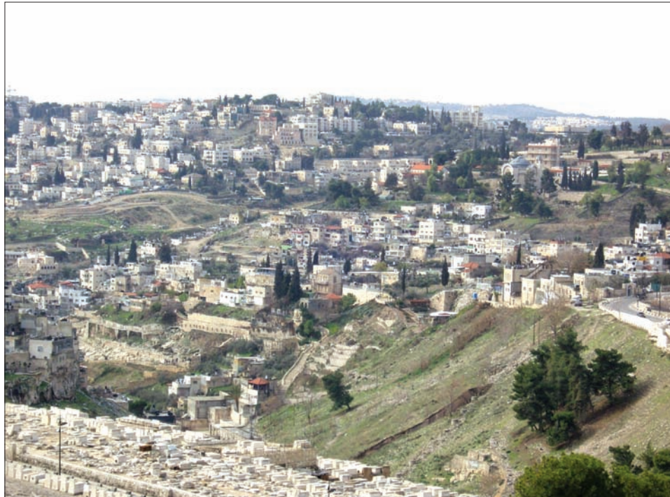
다윗의 도시 전경