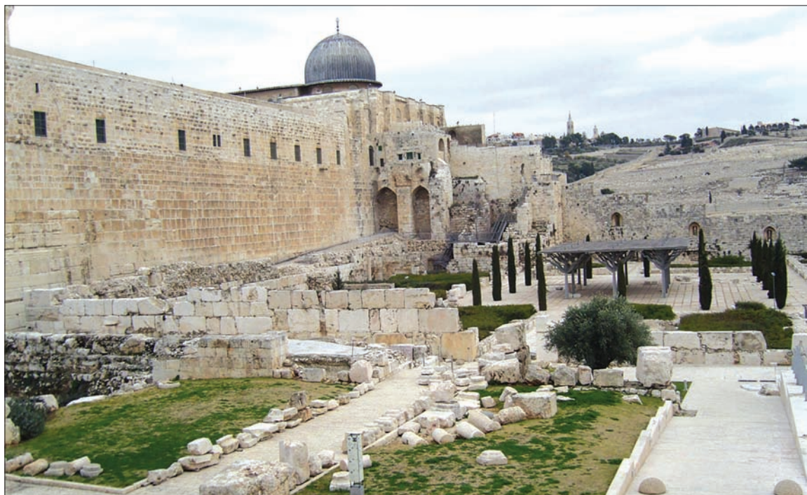
오렐 지역 예루살렘 성 남쪽 지역