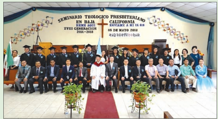
졸업식을 마친 후 기념촬영