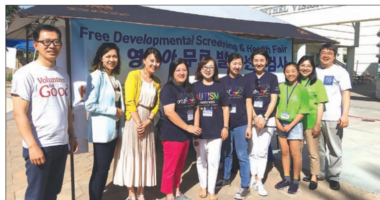
영유아 발달 무료 검사를 실시한 센터 관계자들

남가주한인교회음악협회가 20일(주일) 오후 5시 지휘자·반주자·교회음악인들을 위한 성가곡집 리딩 세션을 황현정, 안재숙, 조성원, 서병호 씨 등을 강사로 대흥장로교회(15411 S Figueroa St, Gardena, CA 90248)에서 연다. 선착순 50명. 한편, 이 행사를 방문해 성가곡집을 주문하면 빛나라 출판사에서 특별 할인을 제공한다. 문의) 310-381-9835