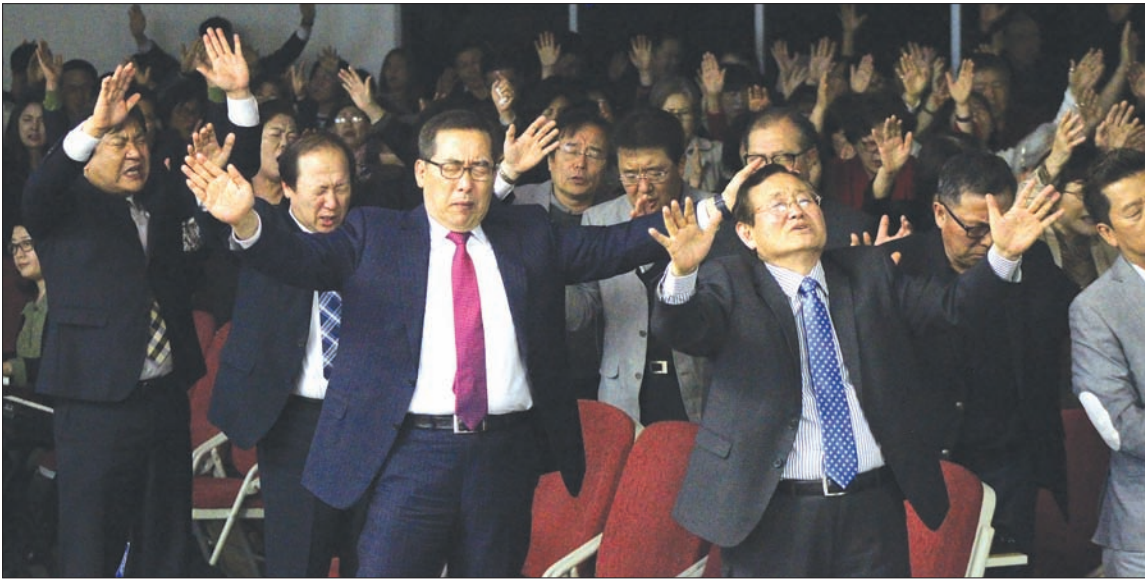
국가 기도의 날 행사에서 참석자들이 뜨겁게 기도하고 있다.