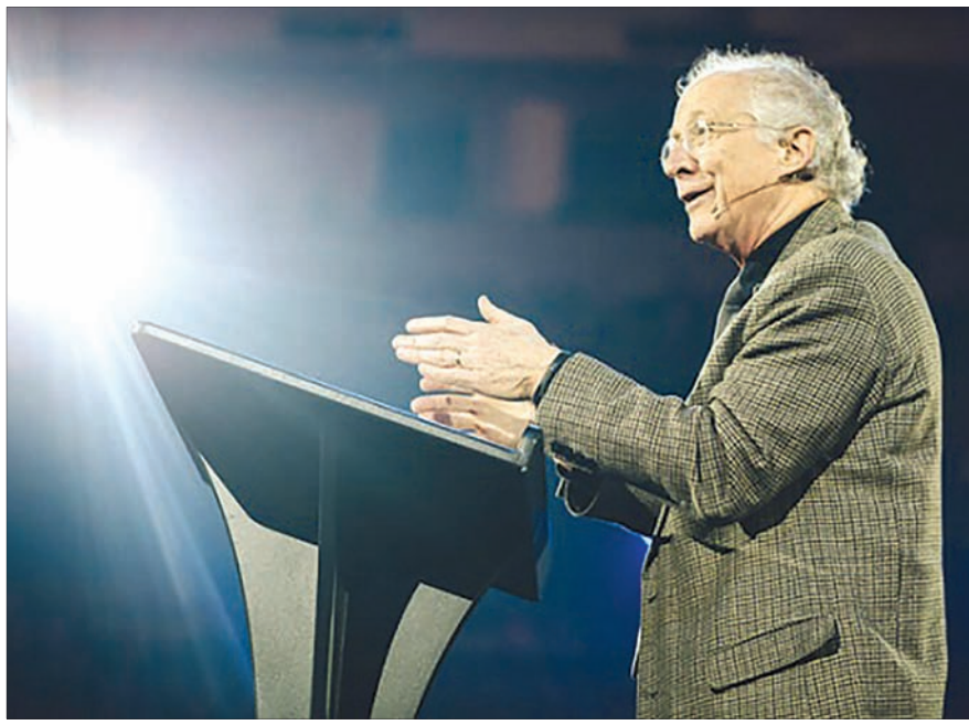
존 파이퍼 목사