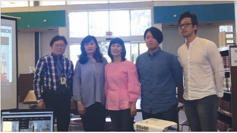
ICMM이 선교지에 랩탑을 기증하는 운동을 시작한다.