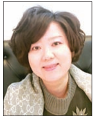
오 중 숙 상담원 한인기독교상담소

“꽃으로도 때리지 말라”는 배우 김혜자의 책 제목처럼 향기 짙고 아름다운 꽃이라도 때리는 도구가 될 때 그것은 흥기가 되고 한 사람의 영혼을 아프게 하고 생채기를 내는 도구가 된다. 요즘 아동학대가 사회적 쟁점이 되고 있다. 아동학대(Child abuse)란 어린이를 괴롭히거나 가혹하게 대하는 학대, 또는 보호자를 포함한 성인이 아동의 건강 또는 복리를 해치거나 정상적 발달을 저해할 수 있는 신체적, 정신적, 성적, 정서적 폭력이나 가혹행위를 가하는 것을 말하며, 방임도 아동학대에 포함된다.