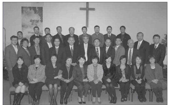
풀러신학대학원 한인 동문들이 모두 한 자리에 모여 신년을 맞이했다.