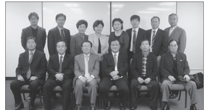
미주성결대 시무예배 참석자들이 기념촬영에 임했다.