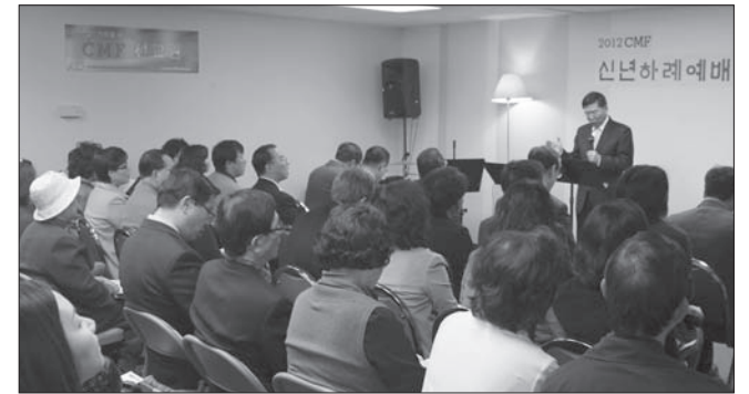
CMF가 신년하례 및 감사예배를 통해 2012년 사역의 시작을 알리고 있다.

미주 지역의 가장 대표적인 가정 사역단체인 CMF가 지난 7일 신년 하례 및 감사예배를 드렸다. 이 예배에는 CMF 사역을 후원해 온 교회의 목회자들이 다수 참여해 CMF 사역을 격려했다.