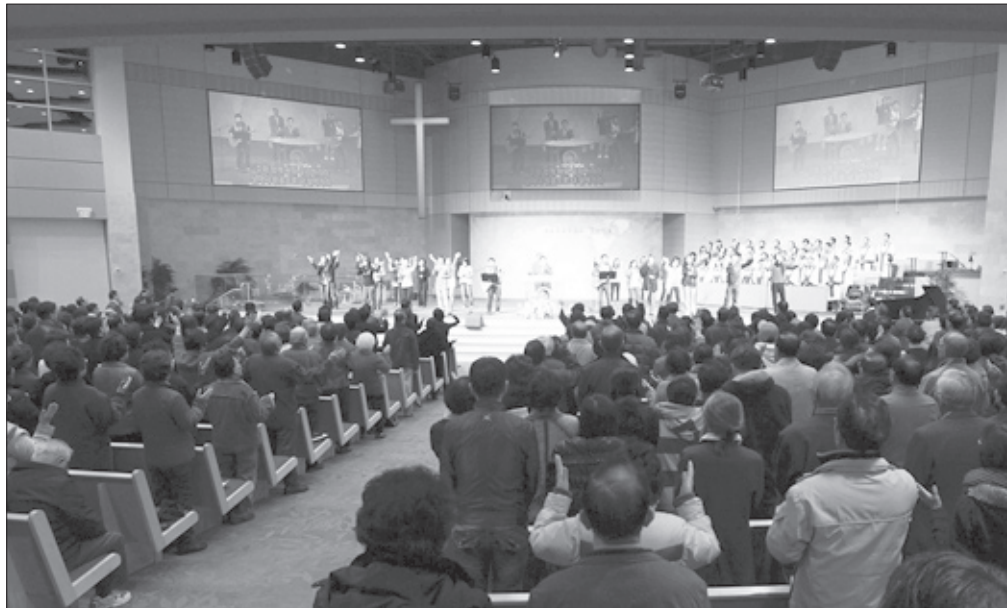
베델한인교회의 엘리야 특새가 성전 본당이 가득찬 가운데 매일같이 진행되고 있다.

베델한인교회 성도들이 갈멜산의 엘리야처럼 미국과 조국, 북한을 위해 뜨겁게 기도하고 있다. 1월 3일부터 시작된 베델한인교회의 특별새벽