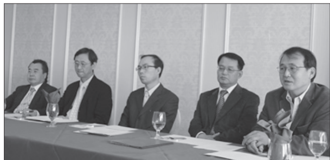
크로스미션 관계자들이 기자회견을 통해 북한 어린이 돕기 행사를 소개하고 있다.

북한에는 현재 결핵환자가 약 500만 여명으로 추산되고 있다. 매년 환자가 100만 여명이 증가하고 있고 이중 어린이 환자가 30만 여명으로 추산된다.