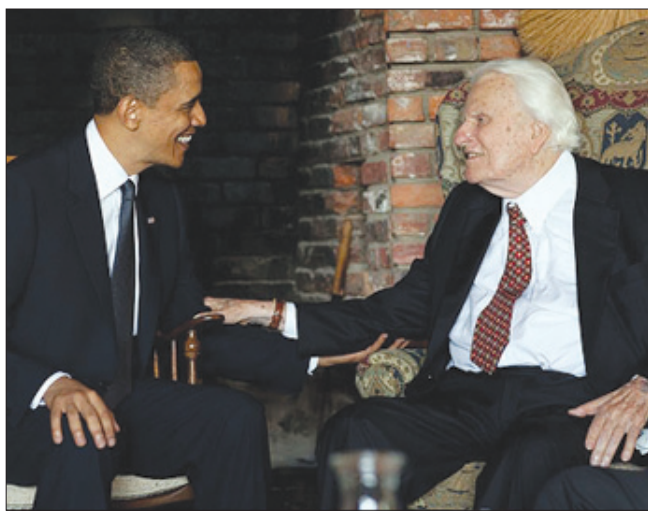
손현정 기자 최근 바나그룹 조사에서 미국에서 가장 영향력 있는 기독교인 지도자 1, 3위로 나타난 빌리 그레함 목사(우)와 버락 오바마 대통령(좌)

전도협회(BGEA) 대표 프랭클린 그레함 목사, 흑인 대형교회 목회자이면서 가스펠 앨범으로 그래미상을 수상하기도 한 T.D. 제이크스 목사 등이 포함됐다. 또 조지 W. 부시 전 대통령, 방송인 오프라 윈프리, 흑인 여성 시인 마야 앤젤루, 포커스온더패밀리(FOTF) 창립자인 제임스 톰슨 목사 등이 있었다. 한편 이번 조사에서는 1위인 그레함 목사가 19%만의 선택을 받았을 정도로 절대 다수가 가장 영향력 있는 기독교인 지도자로 꼽는 인물은 나오지 않았다는 것이 특징이다. 또한 41%의 응답자는 특별히 떠오르는 인물이 없다고 답했다. 바나그룹의 린 해너씨는 “조사가 선택할 수 있는 인물 보기를 제공하는 방식이 있었다면 다른 결과가 나올 수도 있었을 것으로 보인다”고 말했다. 해너씨는 한편, 이번 조사 결과 가장 영향력 있는 기독교인 지도자들로 손꼽힌 이들의 공통점 중 하나로 이들이 “각자 자신의 분야에서 두드러진 활동을 통해서 미디어상에서 강력한 존재감을 보이고 있다”는 점을 꼽았다.