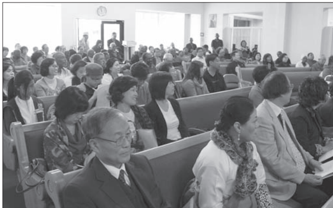
울타리선교회가 이웃들을 초청한 가운데 찬양으로 감사예배를 26일 드렸다.