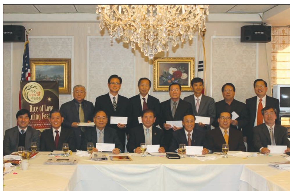
사랑의 쌀 나눔 운동을 벌이고 있는 교계 지도자들이 성금 전달식을 통해 이 운동에 참여를 호소하고 있다.