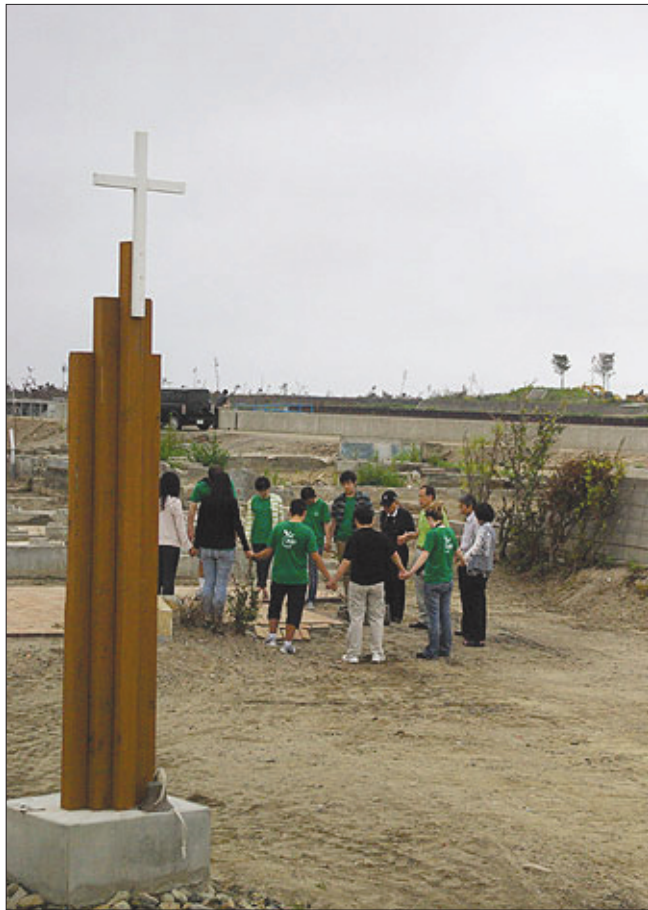
손현정 기자 대지진으로 황폐해진 일본에 복음을 전하려는 기독교 선교단체들의 노력이 시작됐다.

고, 이에 Asian Access에 지원을 요청하기에 이르렀다. 한편, 새로운 방식의 사역인 파트너십을 통해서 두 단체는 각 단체가 단독으로 사역할 때보다 재정과 복음전파 속도 면에서 유익이 있을 것으로 기대했다. SIM은 현재까지 1,600명 이상의 선교사들을 50여 국가에 파송해 왔다. 이번 파트너십에서 SIM은 그동안의 노하우를 살려 선교사 모집, 훈련과 이를 위한 재정을 담당하기로 했다. Asian Access는 1967년 일본에서 사역을 시작해 현재까지 일본 전역에 600여개의 교회를 개척한 것으로 알려졌다. 또 지난 40년 동안 일본 지역 교회를 설립 많은 장·단기 선교사를 파송했고, 일본 목회자들의 교회 개척 지원을 비롯해 일본 교회를 돕는 사역을 해 왔다. Asian Access는 앞으로 SIM과의 파트너십에서 그들의 일본 교회 네트워크를 활용해 선교사를 배치하고 전략을 구성하며 선교사 케어를 맡을 계획이다.