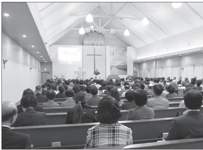
복음장로교회가 새성전 입당예배를 27일 드렸다.

복음장로교회(김상덕 목사)가 1년 7개월 만에 교회 리모델링 공사를 완성, 새성전 입당예배를 27일 오전 11시에 드렸다.